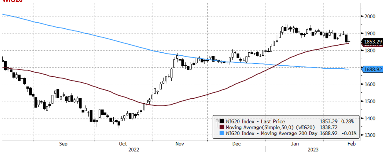
WIG20 Index (WIG20) graph 1550 Daily 14AUG2022-14FEB2023