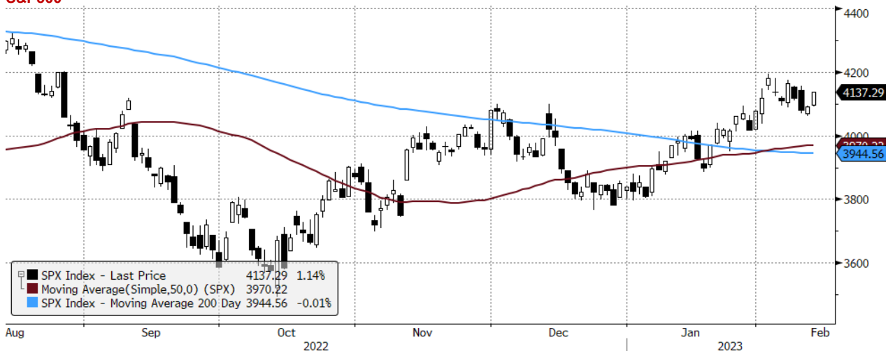
SPX Index (S&P 500 INDEX) G1598 Daily 14AUG2022-14FEB2023