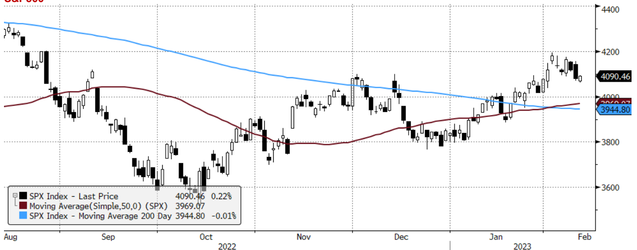
SPX Index (S&P 500 INDEX) G1598 Daily 13AUG2022-13FEB2023