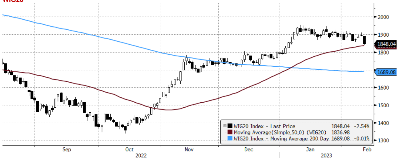
WIG20 Index (WIG20) graph 1550 Daily 13AUG2022-13FEB2023