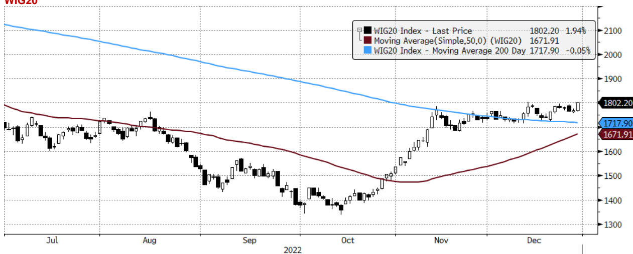
WIG20 Index (WIG20) graph 1550 Daily 30JUN2022-30DEC2022