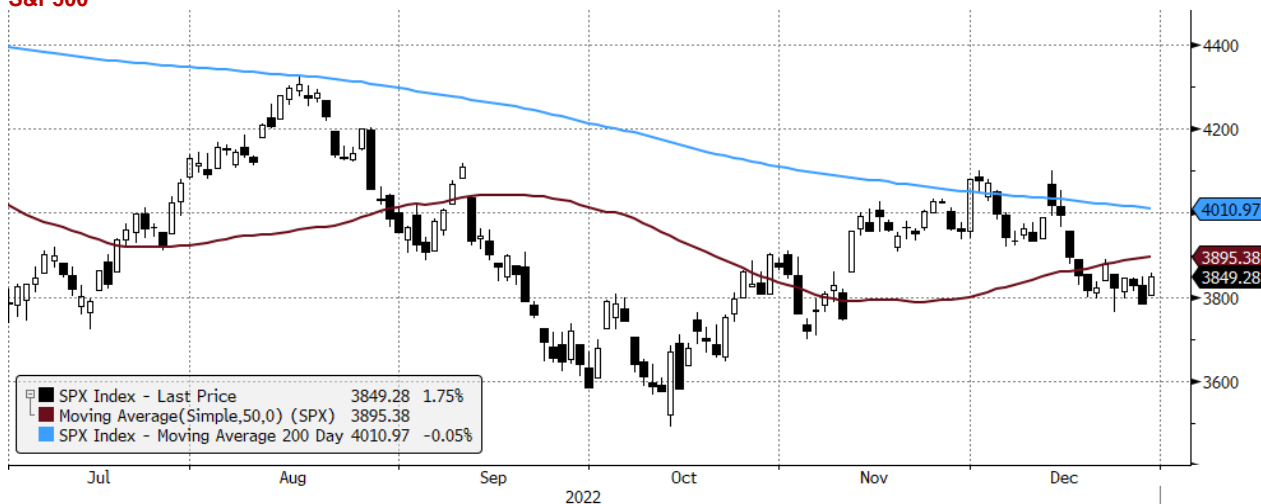
SPX Index (S&P 500 INDEX) G1598 Daily 30JUN2022-30DEC2022