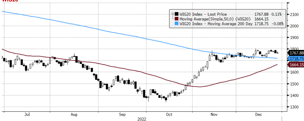
WIG20 Index (WIG20) graph 1550 Daily 29JUN2022-29DEC2022