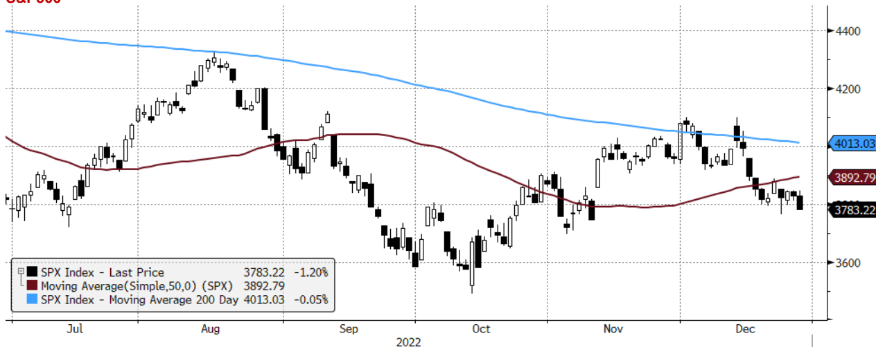
SPX Index (S&P 500 INDEX) G1598 Daily 29JUN2022-29DEC2022