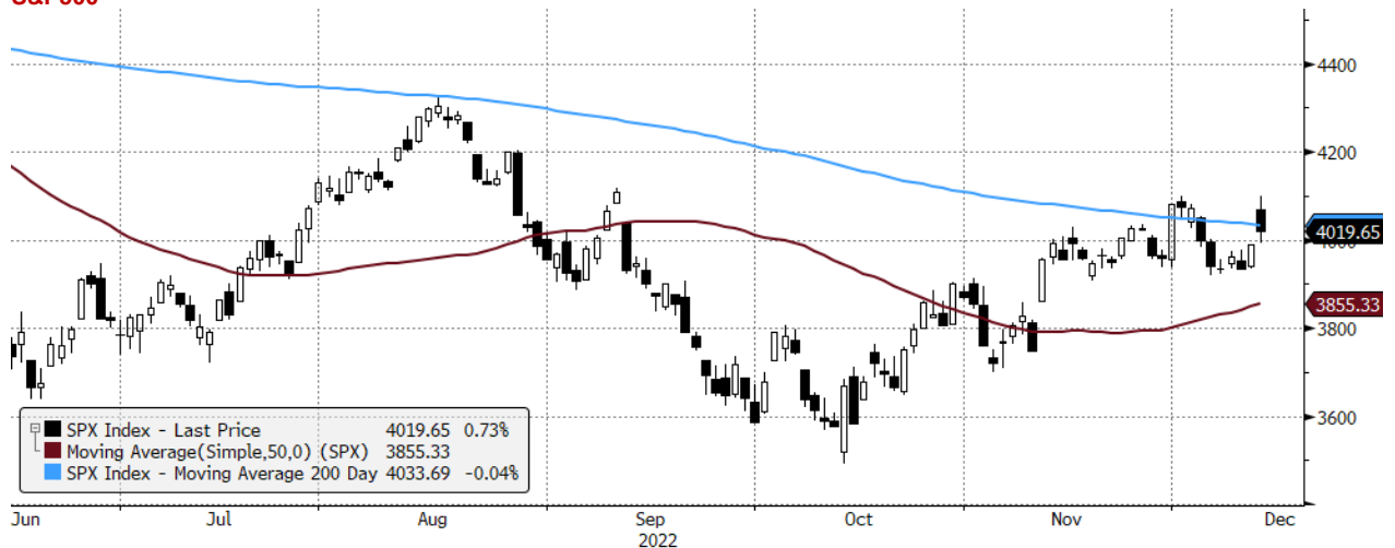
SPX Index (S&P 500 INDEX) G1598 Daily 14JUN2022-14DEC2022