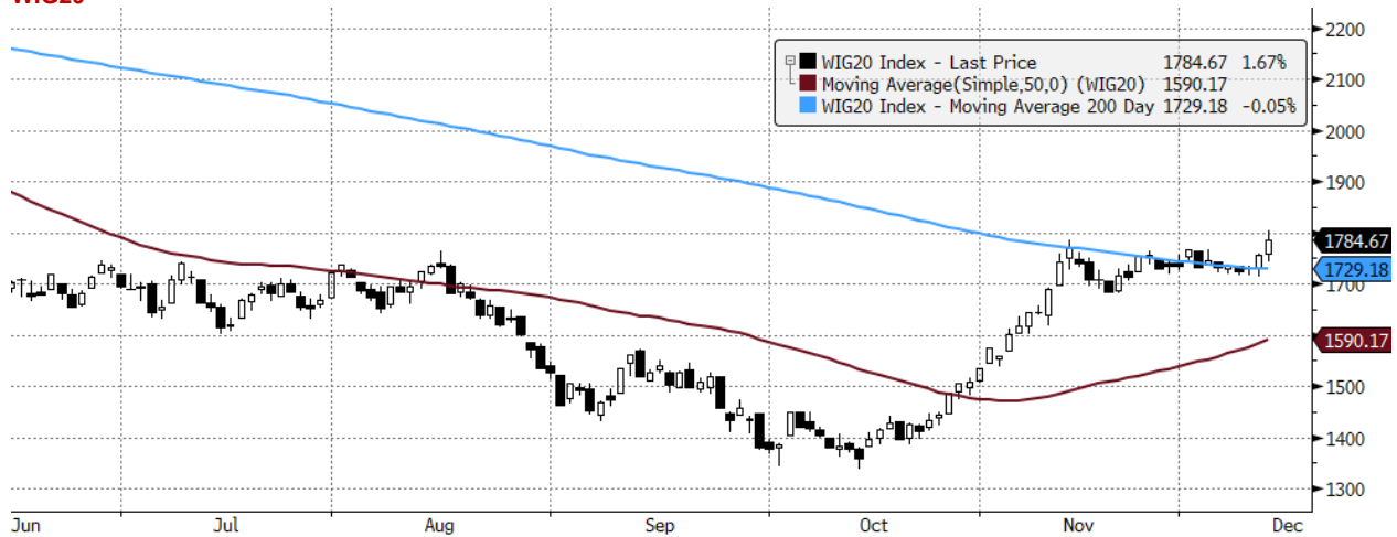
WIG20 Index (WIG20) graph 1550 Daily 14JUN2022-14DEC2022