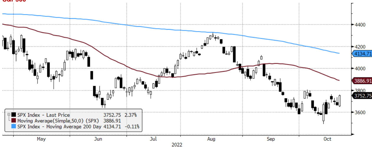
SPX Index (S&P 500 INDEX) G1598 Daily 24APR2022-24OCT2022