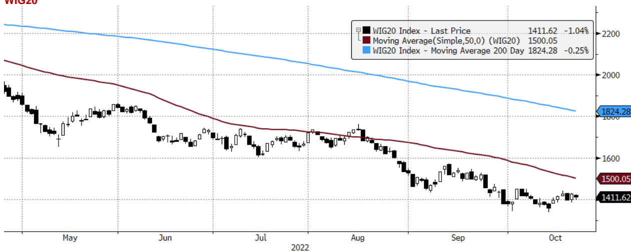
WIG20 Index (WIG20) graph 1550 Daily 24APR2022-24OCT2022