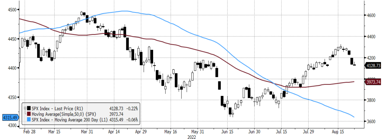
SPX Index (S&P 500 INDEX) G1598 Dailly 24FEB2022-24AUG2022