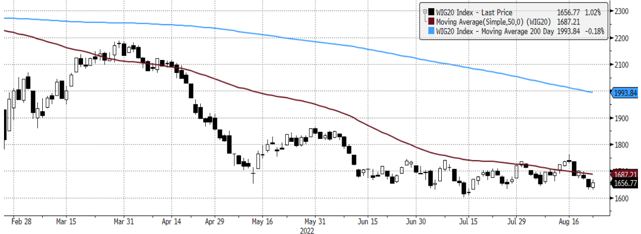
WIG20 Index (WIG20) graph 1550 Dailly 24FEB2022-24AUG2022