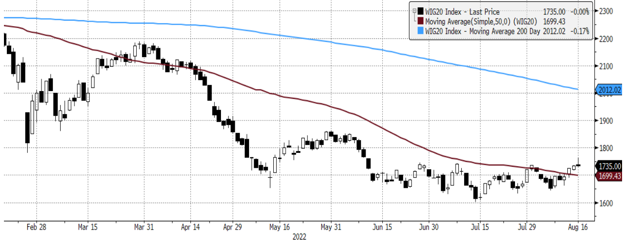
WIG20 Index (WIG20) graph 1550 Daily 17FEB2022-17AUG2022