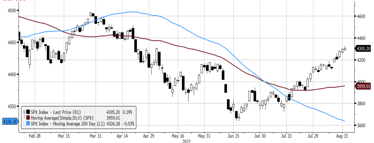
SPX Index (S&P 500 INDEX) G1598 Daily 17FEB2022-17AUG2022