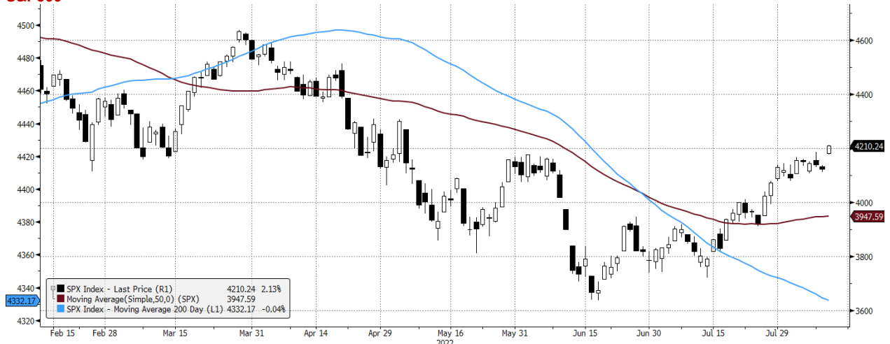
SPX Index (S&P 500 INDEX) G1598 Daily 11FEB2022-11AUG2022