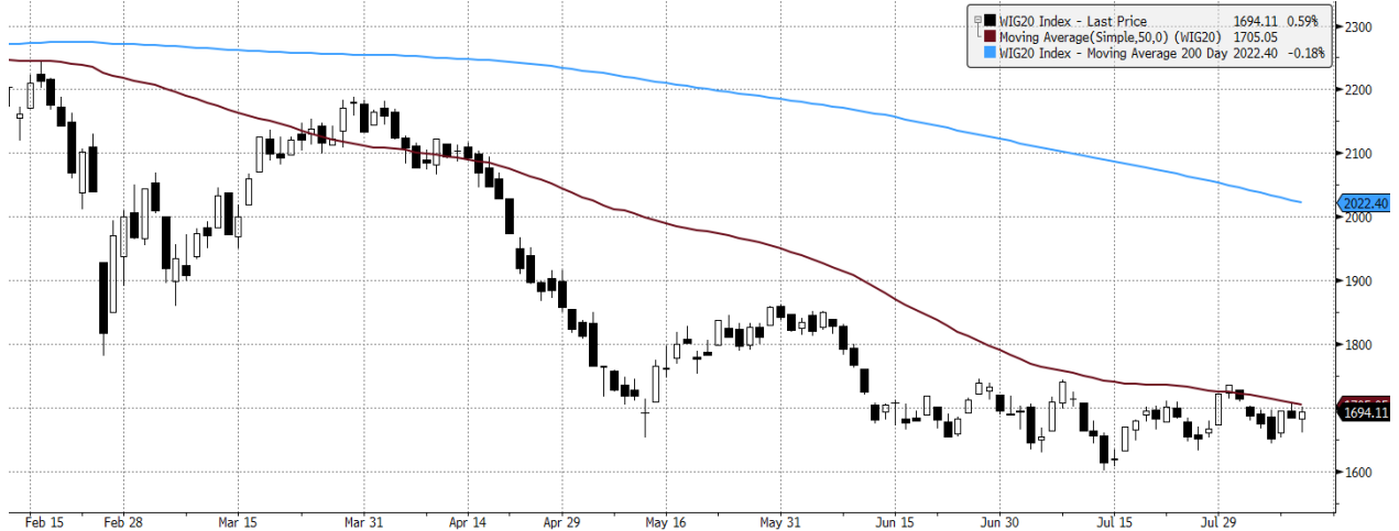
WIG20 Index (WIG20) graph 1550 Daily 11FEB2022-11AUG2022