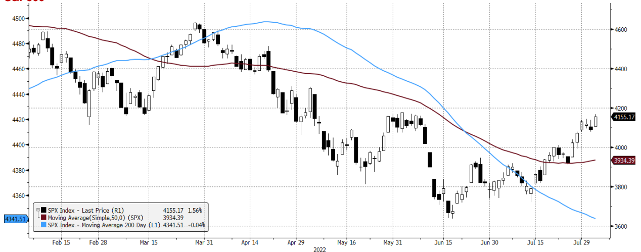
SPX Index (S&P 500 INDEX) G1598 Daily 04FEB2022-04AUG2022