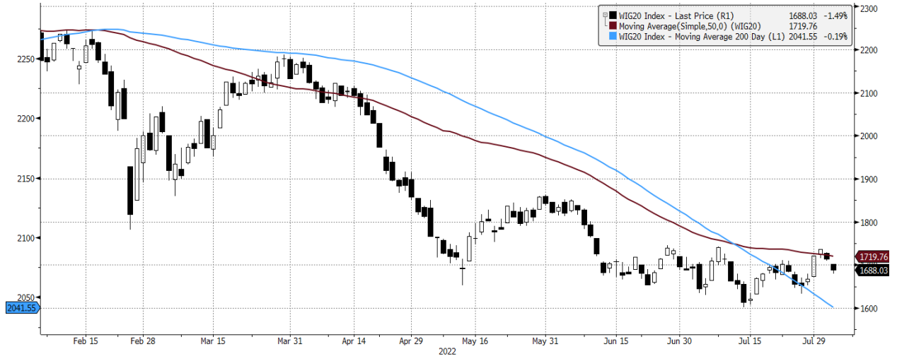
WIG20 Index (WIG20) graph 1550 Daily 04FEB2022-04AUG2022