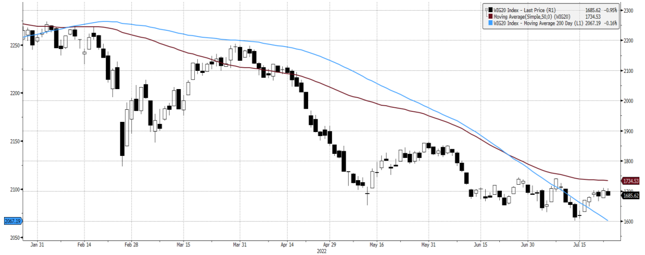
WIG20 Index (WIG20) graph 1550 Daily 26JAN2022-26JUL2022