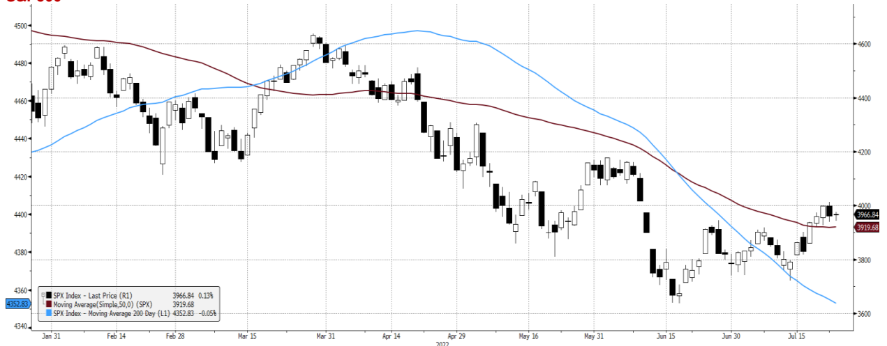
SPX Index (S&P 500 INDEX) G1598 Daily 26JAN2022-26JUL2022