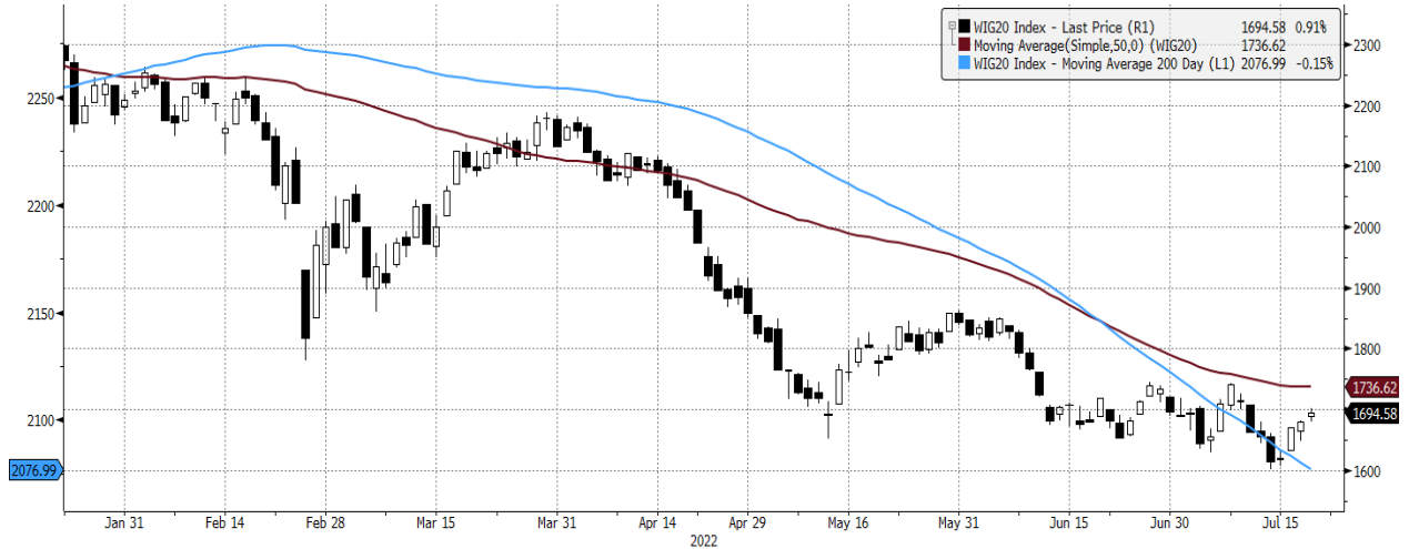
WIG20 Index (WIG20) graph 1550 Daily 21JAN2022-21JUL2022