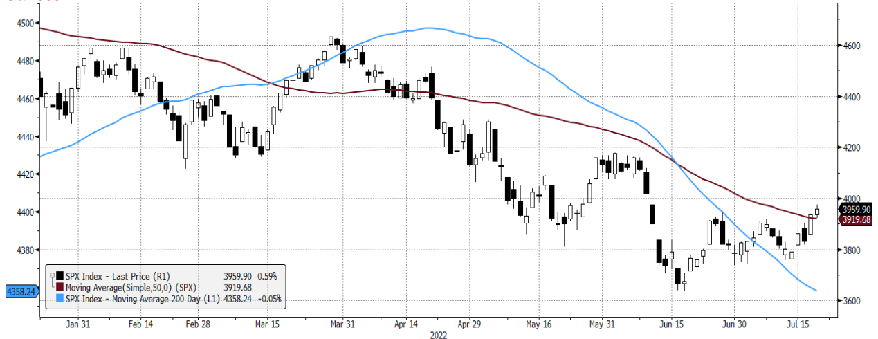
SPX Index (S&P 500 INDEX) G1598 Daily 21JAN2022-21JUL2022