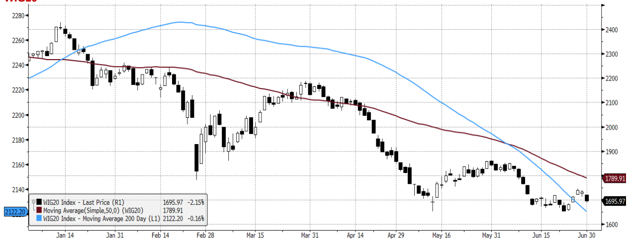
WIG20 Index (WIG20) graph 1550 Daily 01JAN2022-01JUL2022