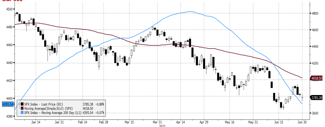
SPX Index (S&P 500 INDEX) G1598 Daily 01JAN2022-01JUL2022