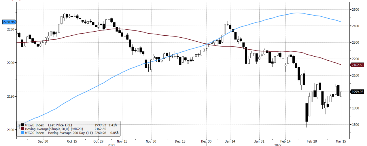
WIG20 Index (WIG20) graph 1550 Daily 16SEP2021-16MAR2022 Copyright© 2022 Bloomberg Finance L.P. 16-Mar-2022 07:27:18

Źródło: Bloomberg, Dom Maklerski BDM S.A.