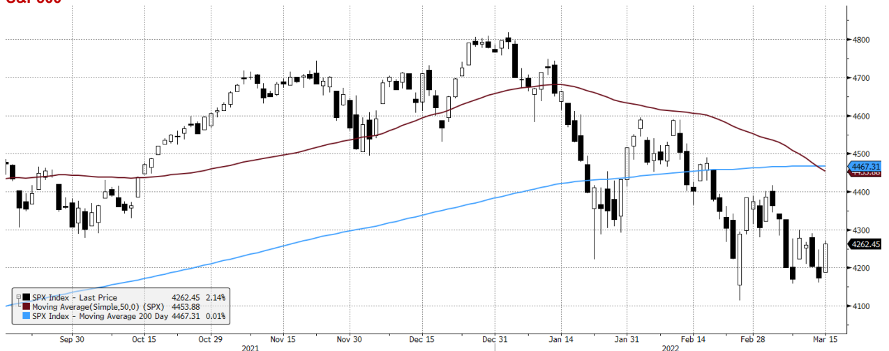
SPX Index (S&P 500 INDEX) G1598 Daily 16SEP2021-16MAR2022 Copyright© 2022 Bloomberg Finance L.P. 16-Mar-2022 07:27:37

Źródło: Bloomberg, Dom Maklerski BDM S.A.