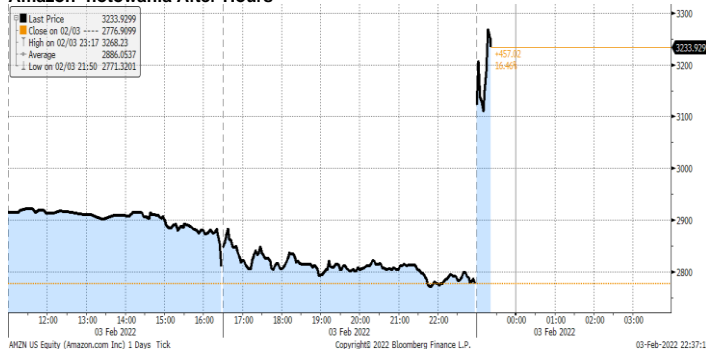
Amazon- notowania After-Hours