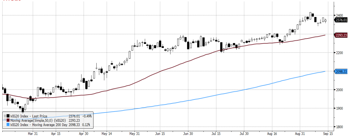
WIG20 Index (WIG20) graph 1550 Daily 15MAR2021-15SEP2021