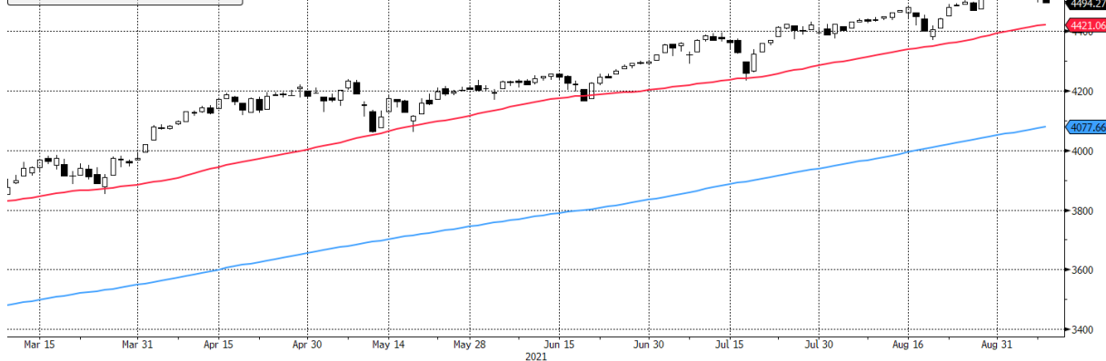
SPX Index (S&P 500 INDEX) g1598 Daily 09MAR2021-09SEP2021

■ SPX Index - Last Price: 4494,29 ■ SPX Index - Moving Average 50 Day: 4421,06 ■ SPX Index - Moving Average 200 Day: 4077,66