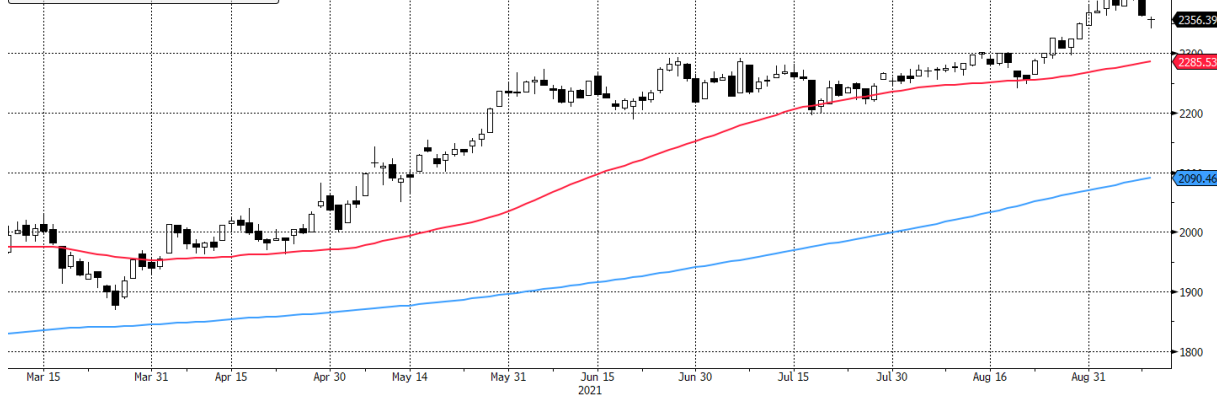
WIG20 Index (WIG20) g1599 Daily 09MAR2021-09SEP2021

■ WIG20 Index - Last Price: 2356,39 ■ WIG20 Index - Moving Average 50 Day: 2285,53 ■ WIG20 Index - Moving Average 200 Day: 2090,46