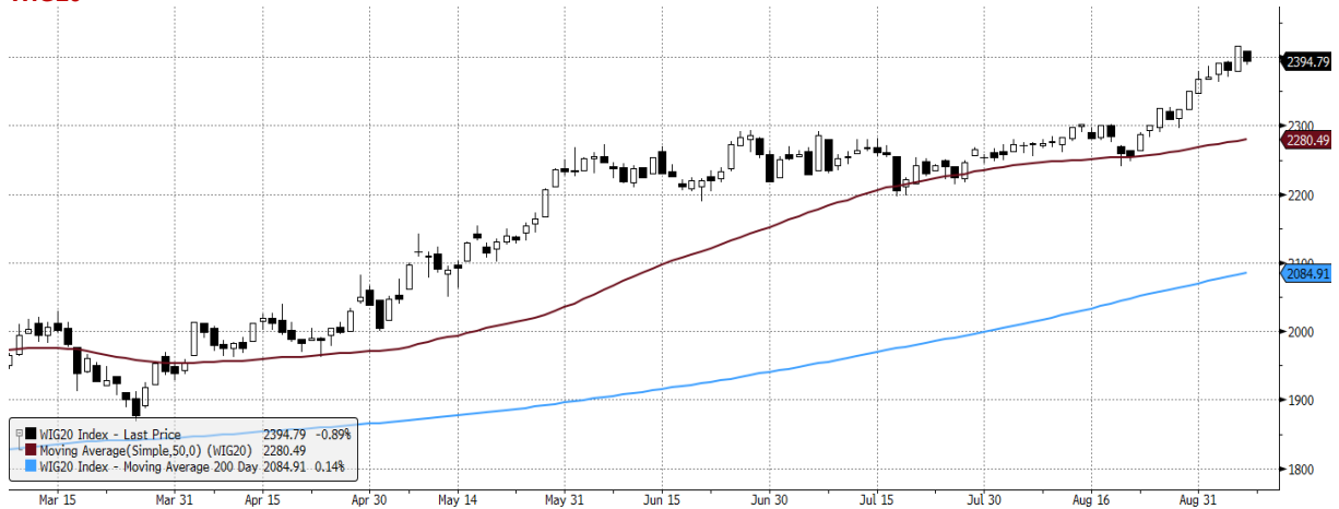
WIG20 Index (WIG20) graph 1550 Daily 08MAR2021-08SEP2021