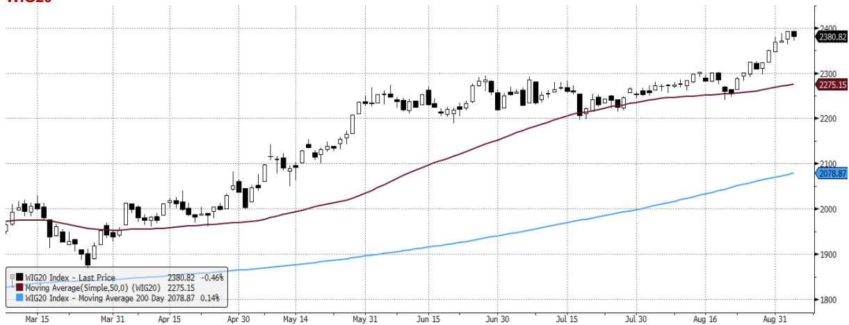
WIG20 Index (WIG20) graph 11550 Daily 06MAR2021-06SEP2021