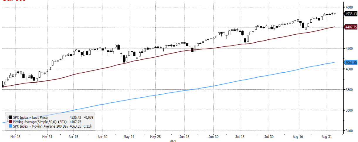
SPX Index (S&P 500 INDEX) G1598 Daily 06MAR2021-06SEP2021