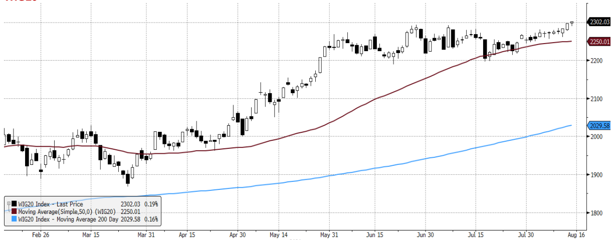
WIG20 Index (WIG20) graph 1550 Daily 16FEB2021-16AUG2021