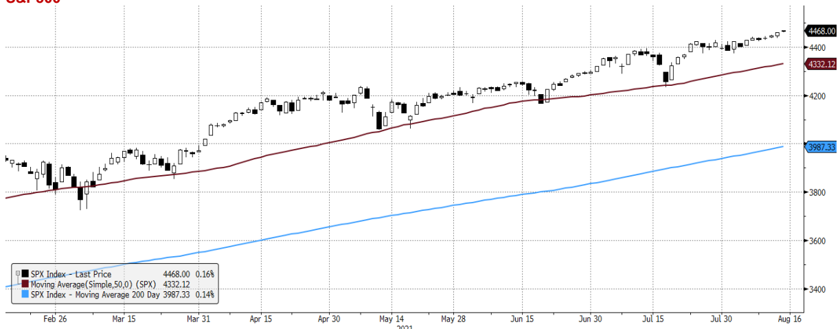
SPX Index (S&P 500 INDEX) G1598 Daily 16FEB2021-16AUG2021