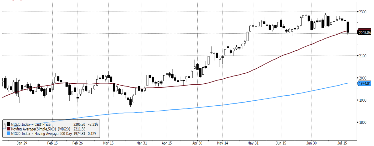
WIG20 Index (WIG20) graph 1550 Daily 20JAN2021-20JUL2021