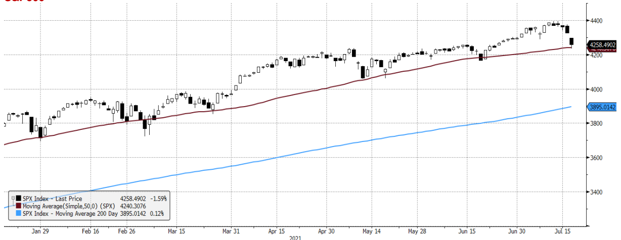
SPX Index (S&P 500 INDEX) G1598 Daily 19JAN2021-20JUL2021