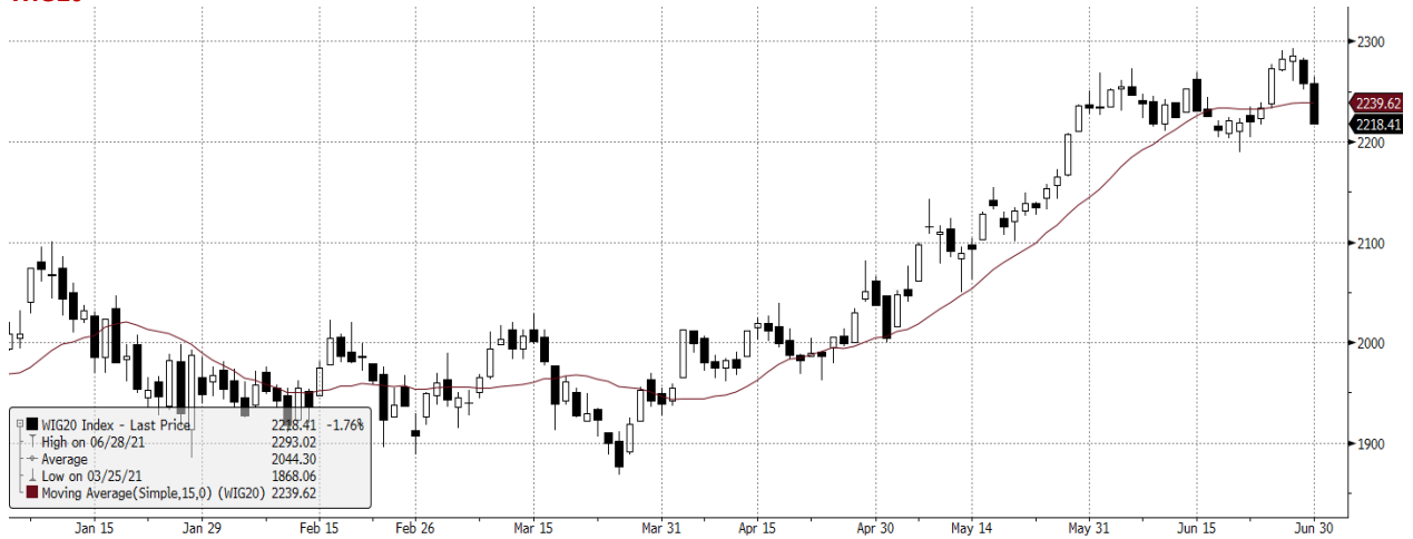
WIG20 Index (WIG20) graph 1550 Daily 01JAN2021-01JUL2021