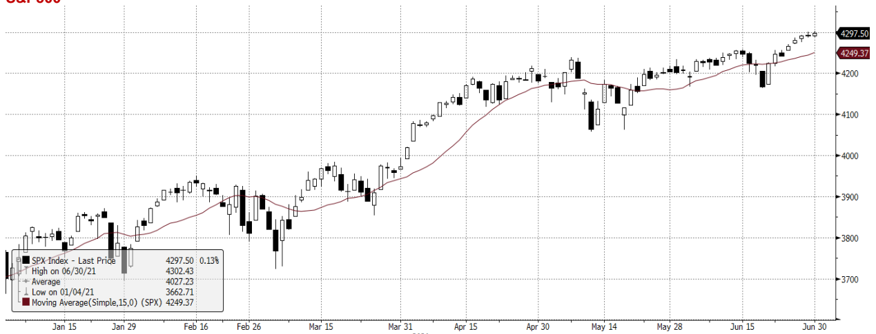
SPX Index (S&P 500 INDEX) G1598 Daily 01JAN2021-01JUL2021