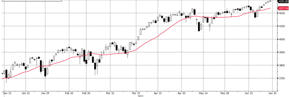
SPX Index (S&P 500 INDEX) g1598 Daily 30DEC2020-30JUN2021

■ SPX Index - Last Price 4291,80 ■ SPX Index - Moving Average 20 Day 4237,36