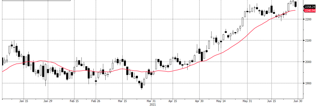
WIG20 Index (WIG20) g1599 Daily 30DEC2020-30JUN2021

■ WIG20 Index - Last Price 2258,24 ■ WIG20 Index - Moving Average: 20 Day 2240,94