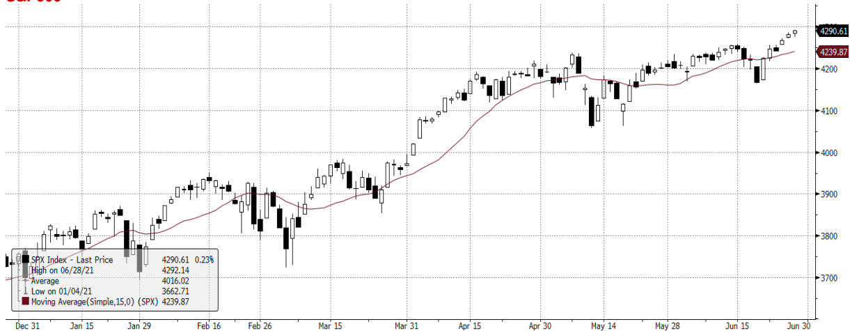
SPX Index (S&P 500 INDEX) G1598 Daily 29DEC2020-29JUN2021