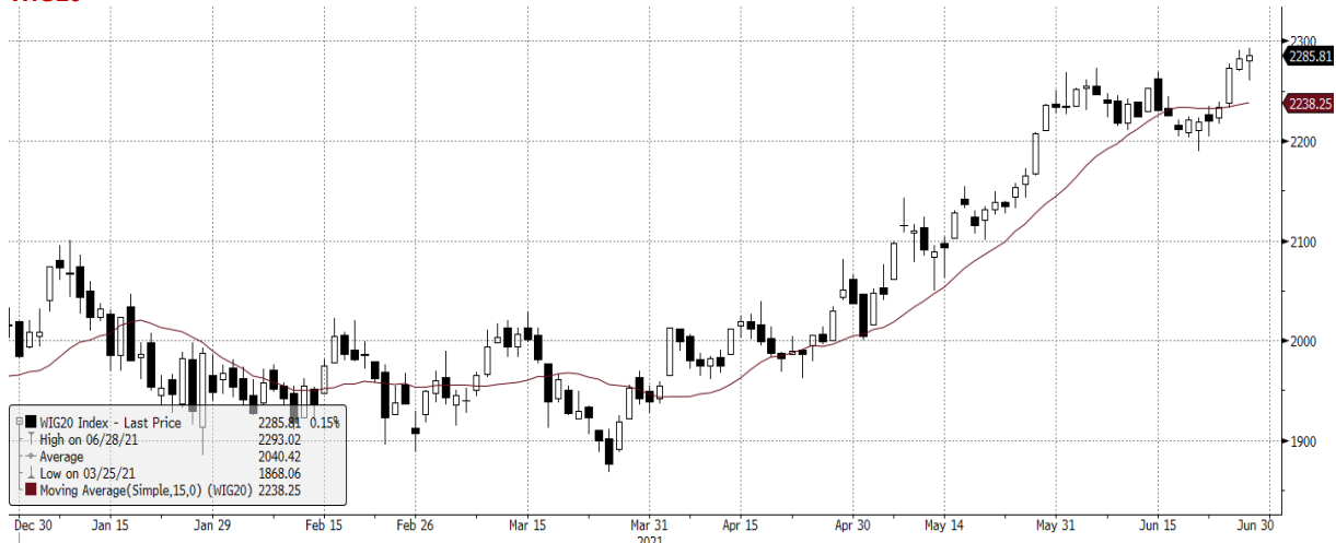
WIG20 Index (WIG20) graph 1550 Daily 29DEC2020-29JUN2021