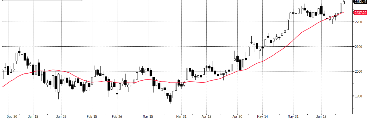
WIG20 Index (WIG20) g1599 Daily 26DEC2020-26JUN2021

WIG20 Index - Last Price 2282.46 WIG20 Index - Moving Average 20 Day 2237.22