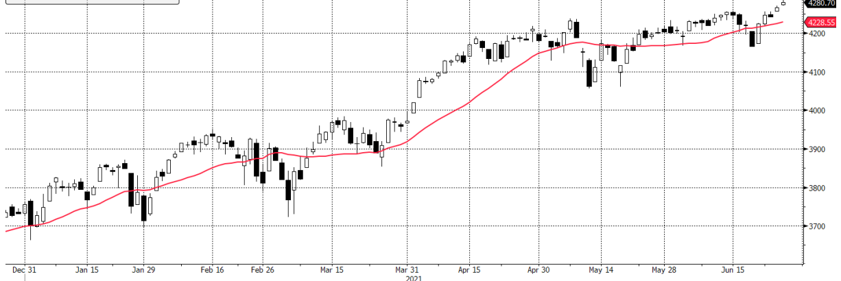
SPX Index (S&P 500 INDEX) g1598 Daily 26DEC2020-26JUN2021

SPX Index - Last Price 4280.70 SPX Index - Moving Average 20 Day 4228.55