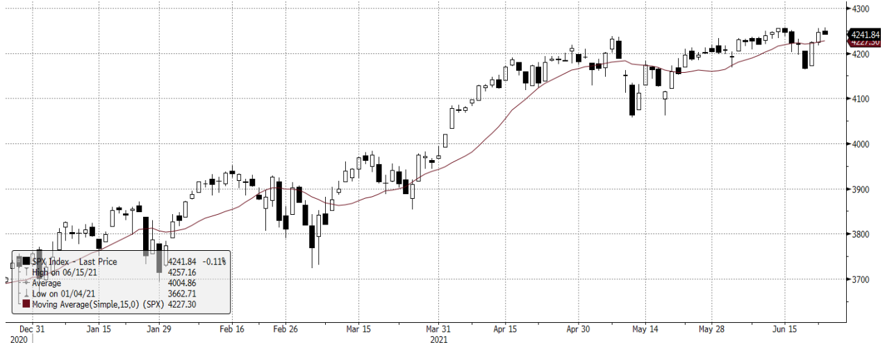
SPX Index (S&P 500 INDEX) G1598 Daily 24DEC2020-24JUN2021