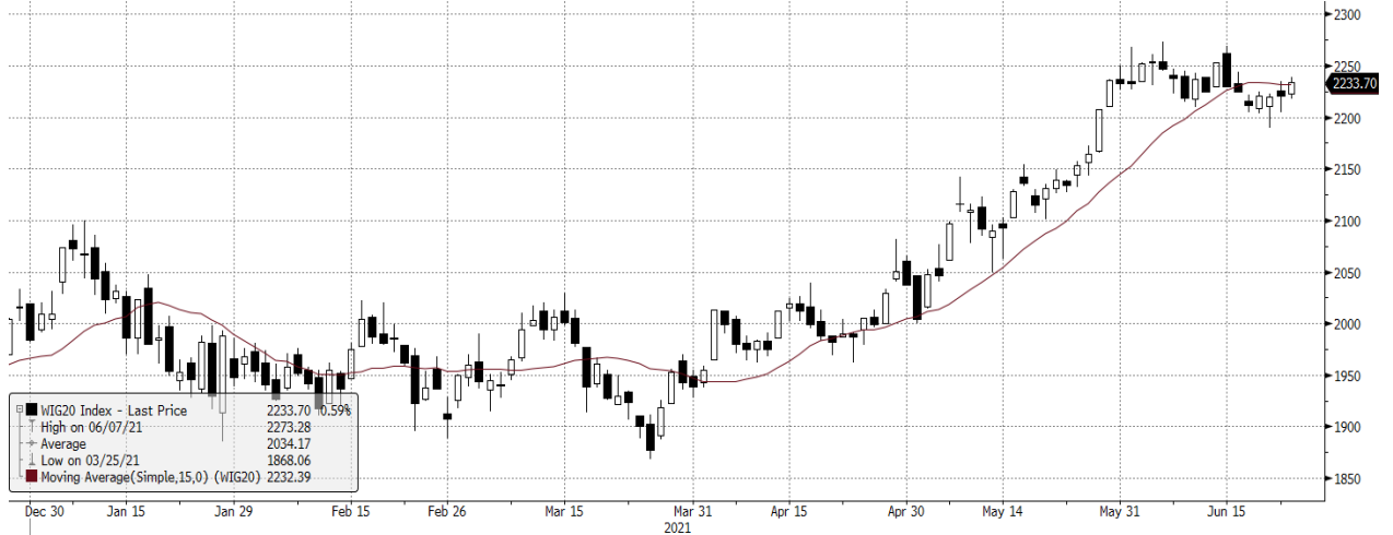
WIG20 Index (WIG20) graph 1550 Daily 24DEC2020-24JUN2021