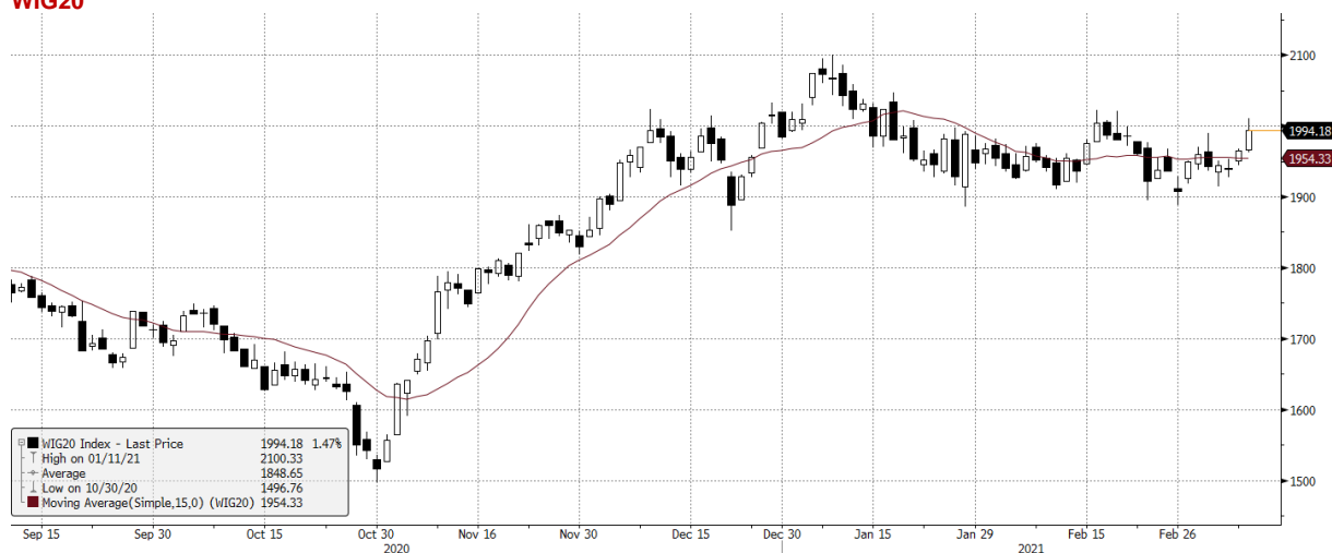
WIG20 Index (WIG20) graph 1550 Daily 10SEP2020-10MAR2021