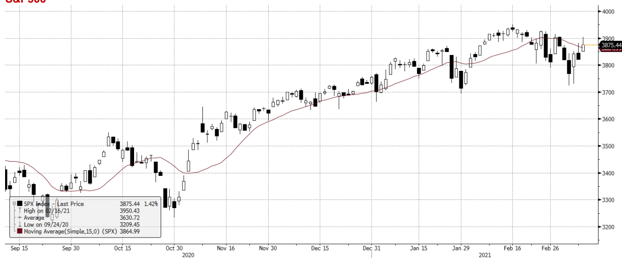
SPX Index (S&P 500 INDEX) G1598 Daily 10SEP2020-10MAR2021