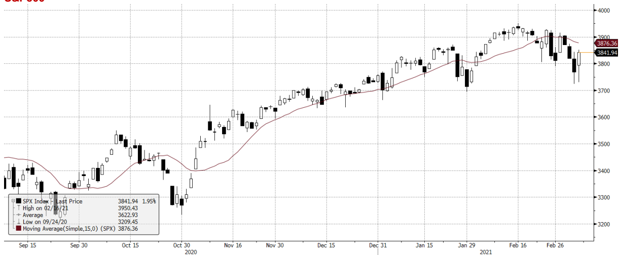
SPX Index (S&P 500 INDEX) G1598 Daily 08SEP2020-08MAR2021