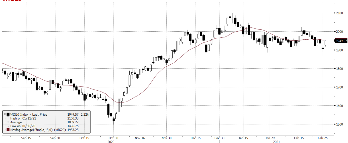
WIG20 Index (WIG20) graph 1550 Daily 02SEP2020-02MAR2021