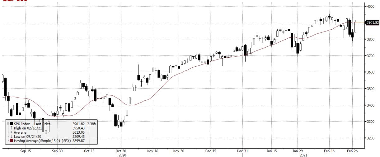
SPX Index (S&P 500 INDEX) G1598 Daily 02SEP2020-02MAR2021

Wydział Analiz i Informacji Dom Maklerski BDM S.A.