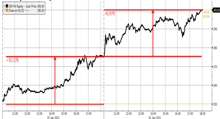
CD Projekt- intraday CD Projekt Equity (CD Projekt SA) Graph 174 2 Days 2 Minutes 26-Jan-2021 23:17:55