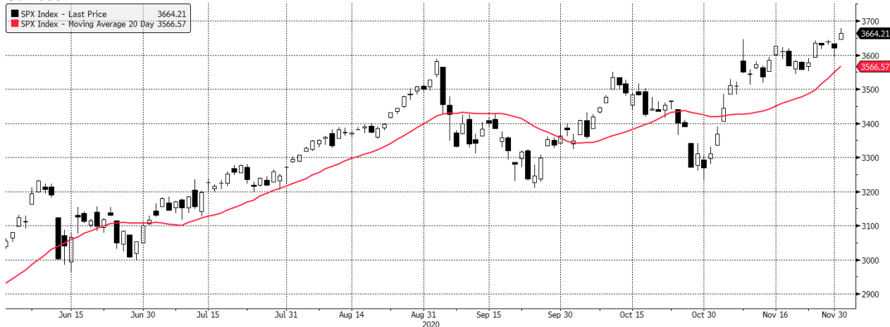
SPX Index (S&P 500 INDEX) g1598 Daily 01JUN2020-01DEC2020