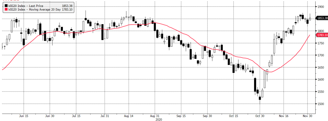
WIG20 Index (WIG20) g1599 Daily 01JUN2020-01DEC2020 Źródło: Bloomberg, Dom Maklerski BDM S.A.