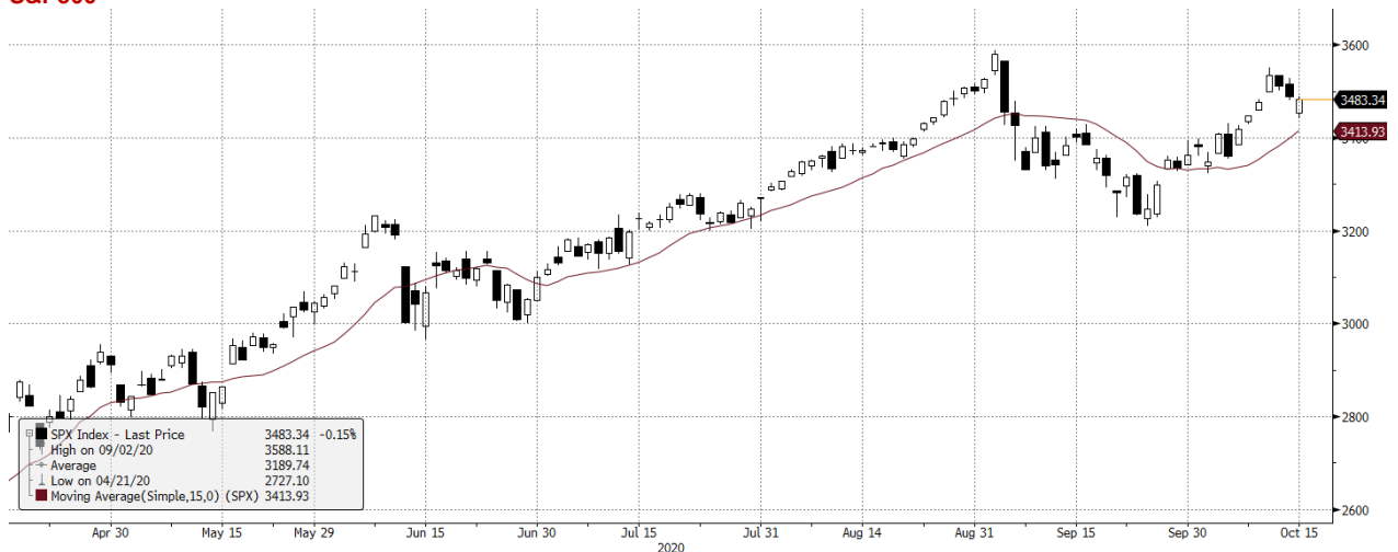
SPX Index (S&P 500 Index) G1598 Daily 16APR2020-16OCT2020 Copyright© 2020 Bloomberg Finance L.P. 16-Oct-2020 07:42:24

Źródło: Bloomberg, Dom Maklerski BDM S.A.