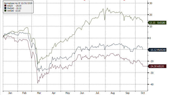
WIG20 Index (WIG20) g1111 Daily 30DEC2019-16OCT2020 Copyright© 2020 Bloomberg Finance L.P. 16-Oct-2020 07:41:10 Źródło: Bloomberg, Dom Maklerski BDM S.A.