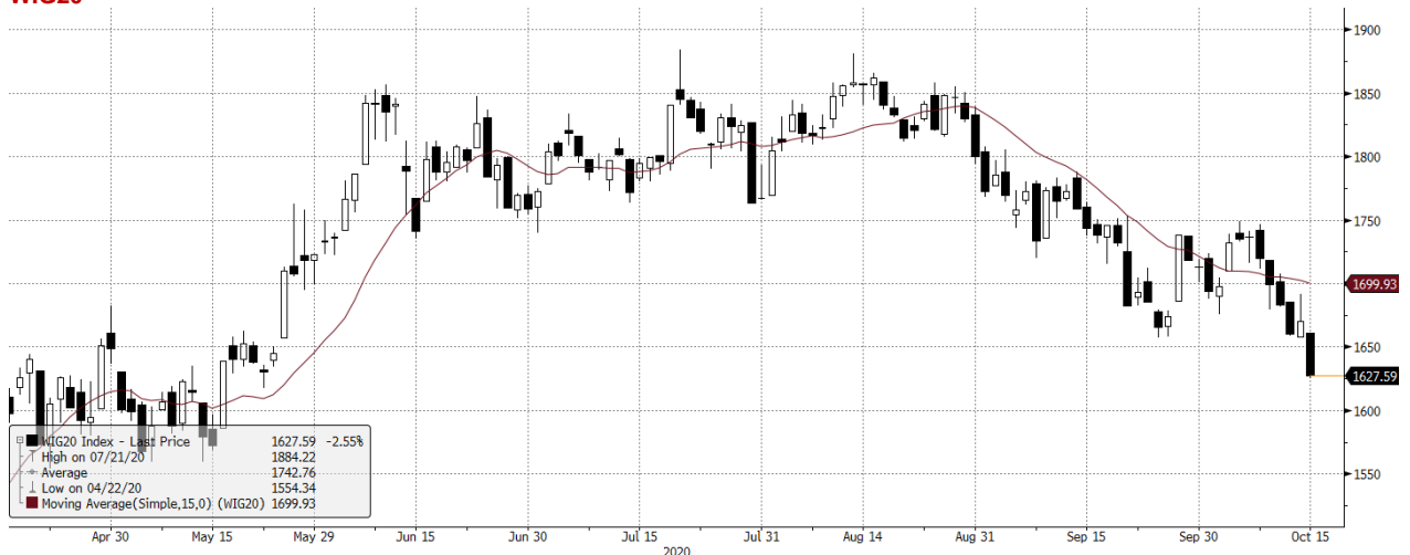
WIG20 Index (WIG20) graph 1550 Daily 16APR2020-16OCT2020 Copyright© 2020 Bloomberg Finance L.P. 16-Oct-2020 07:42:10

Źródło: Bloomberg, Dom Maklerski BDM S.A.