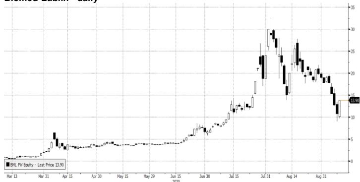
Biomed-Lublin - daily

BML Plw Equity (Biomed-Lublin Wytwórnia Surowic i Szczepionek SA) biuletyn wykres