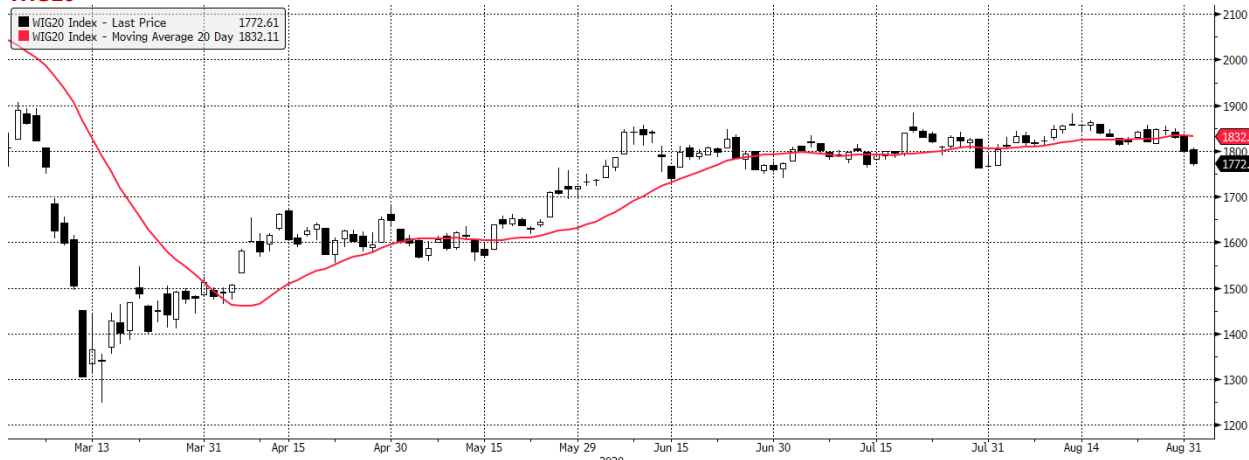
WIG20 Index (WIG20) g1599 Daily 01MAR2020-01SEP2020