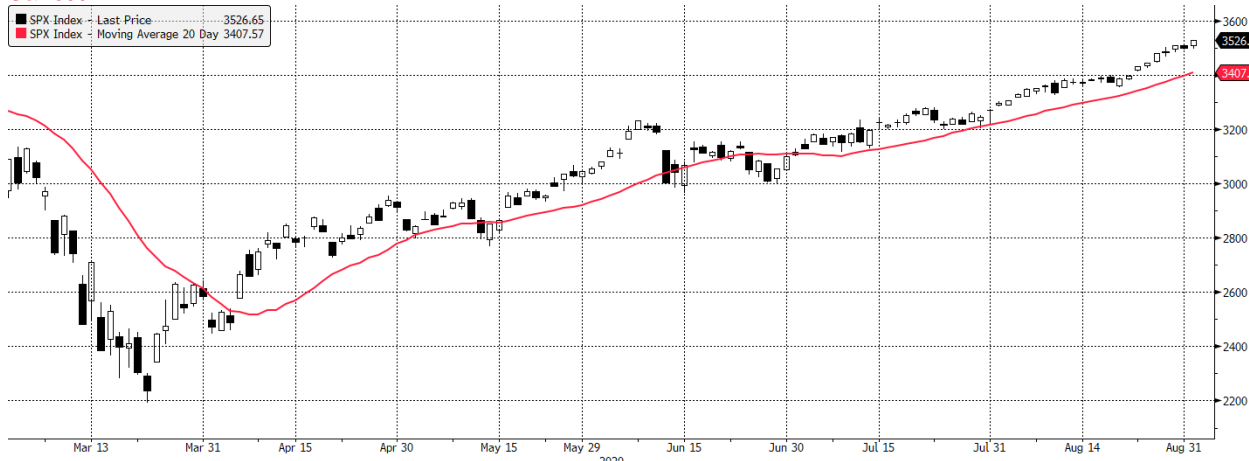
SPX Index (S&P 500 Index) g1598 Daily 01MAR2020-01SEP2020