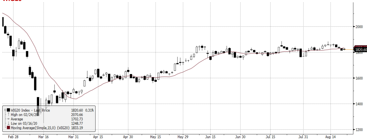
WIG20 Index (WIG20) graph 1550 Daily 24FEB2020-24AUG2020