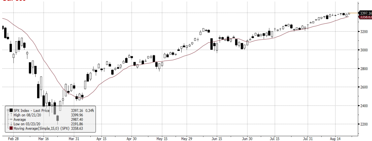
SPX Index (S&P 500 Index) G1598 Daily 24FEB2020-24AUG2020