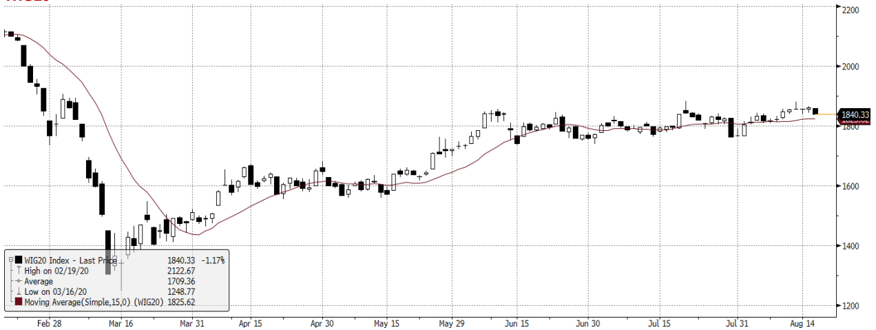
WIG20 Index (WIG20) graph 1550 Daily 19FEB2020-19AUG2020