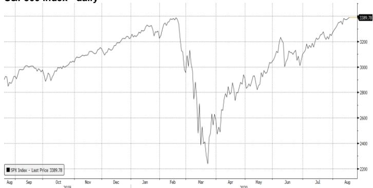
SPX Index (S&P 500 Index) biuletyn wykręś Daily 2019082019-19AUG2020 Copyright 2020 Bloomberg Finance L.P. 19-Aug-2020 07:46:10

Źródło: Dom Maklerski BDM S.A., Bloomberg