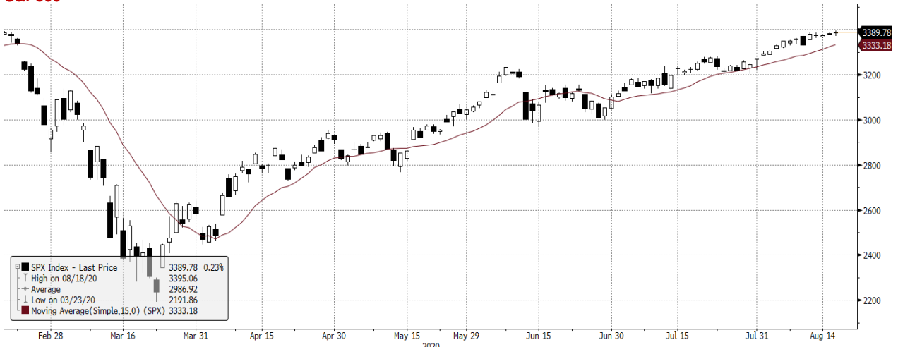
SPX Index (S&P 500 Index) G1598 Daily 19FEB2020-19AUG2020