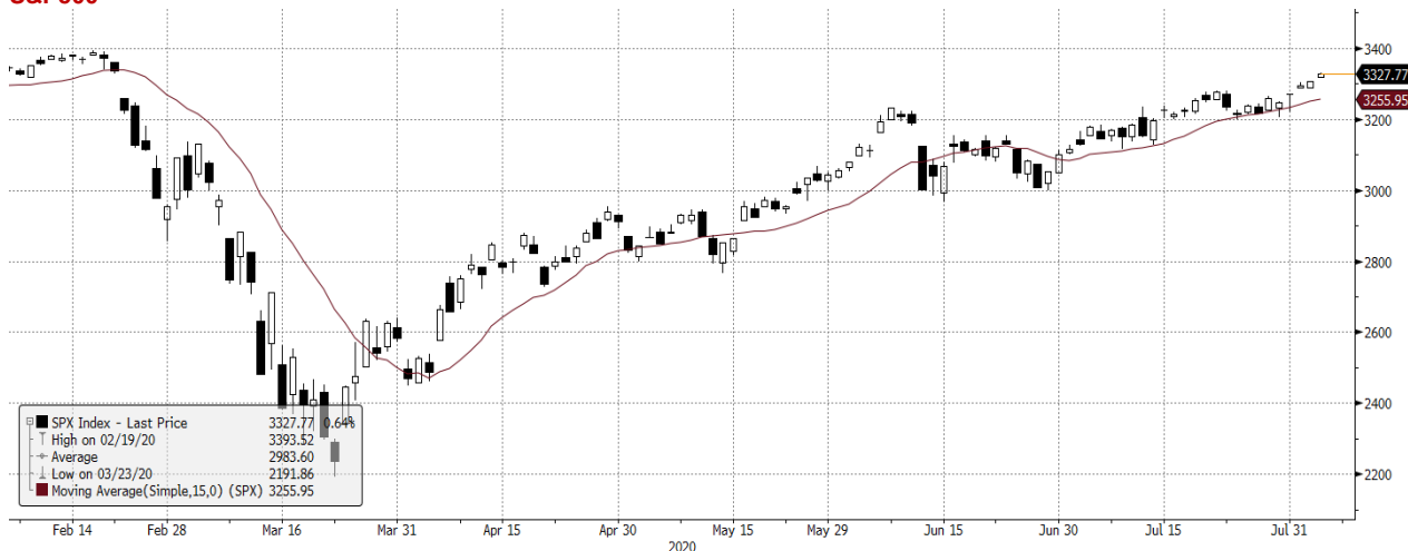
SPX Index (S&P 500 Index) G1598 Daily 06FEB2020-06AUG2020