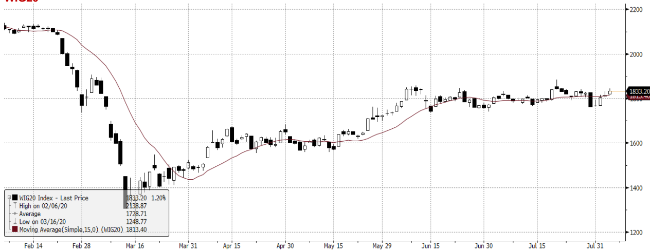
WIG20 Index (WIG20) graph 1550 Daily 06FEB2020-06AUG2020