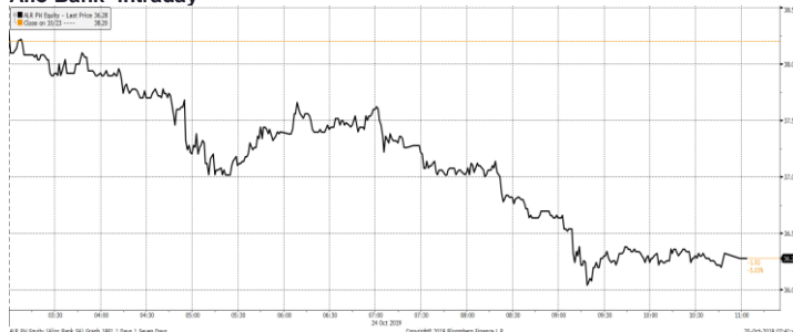
Alior Bank- intraday