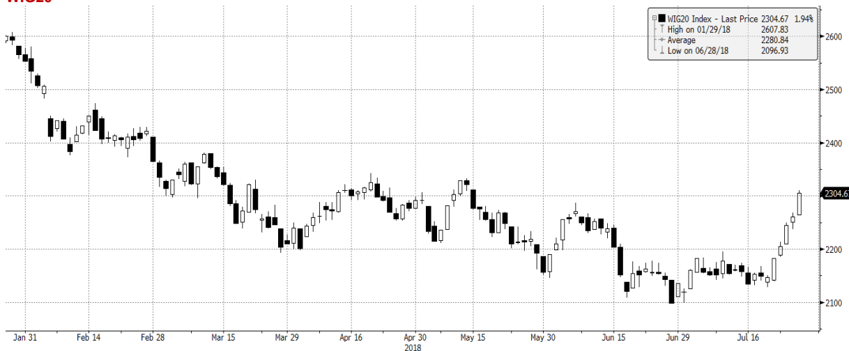
WIG20 Index (WIG20) G1598 Daily 26JAN2018-27JUL2018