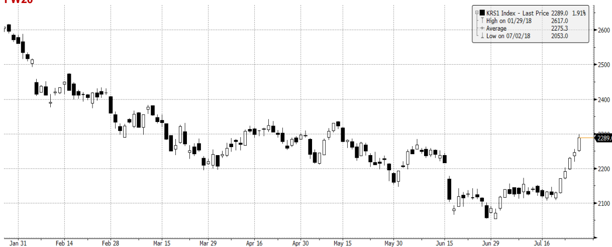
KRS1 Index (WSE WIG20 Index Future) graph 1550 Daily 26JAN2018-27JUL2018