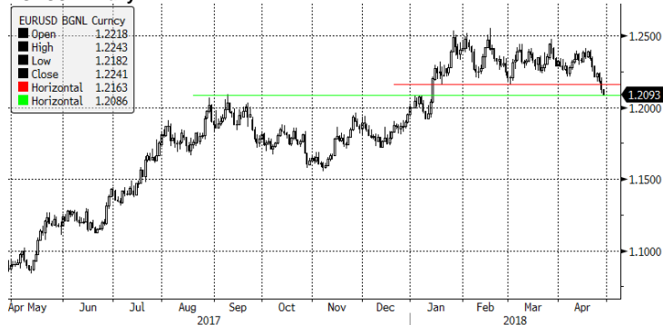
EURUSD Currency (EUR-USD X-RATE) Graph 1721 Daily 27APR2017-27APR2018 Copyright© 2018 Bloomberg Finance L.P. 27-Apr-2018 08:32:18 Źródło: Dom Maklerski BDM S.A., Bloomberg