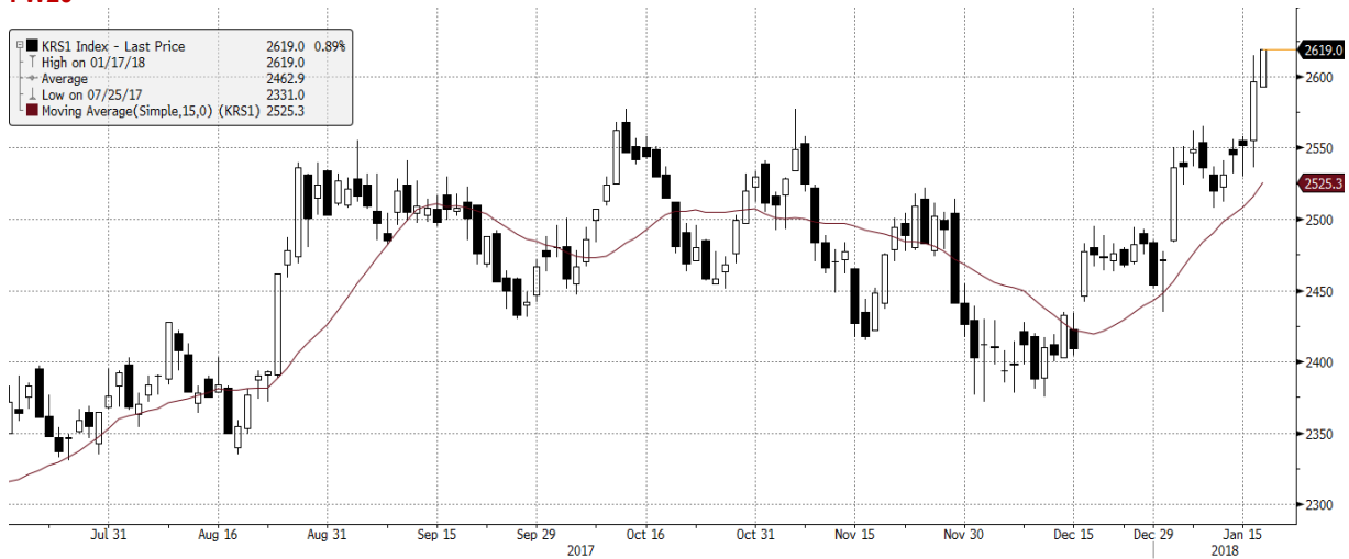
KRS1 Index (WSE WIG20 Index Future) graph 1550 Daily 16JUL2017-18JAN2018