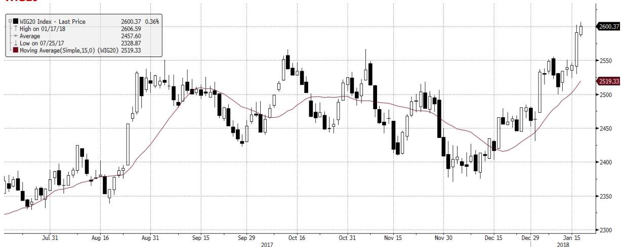
WIG20 Index (WIG20) G1598 Daily 16JUL2017-18JAN2018