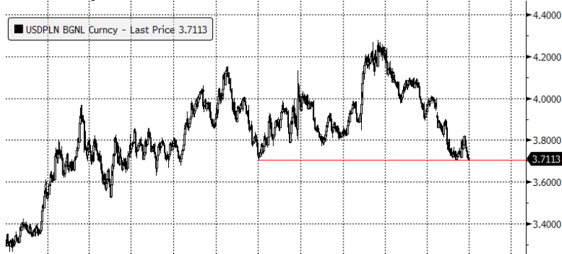
USD/PLN CURRENCY (USD-PLN X-RATE) Graph 1507 Daily 30JUN2014-30JUN2017 30-Jun-2017 08:16:16