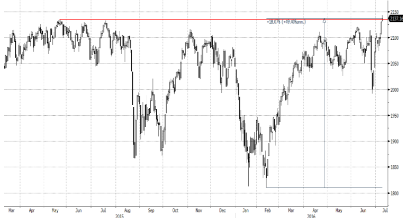
S&P500 Index (S&P 500 Index) Graph 1245 Daily 13MAR2015-12JUL2016