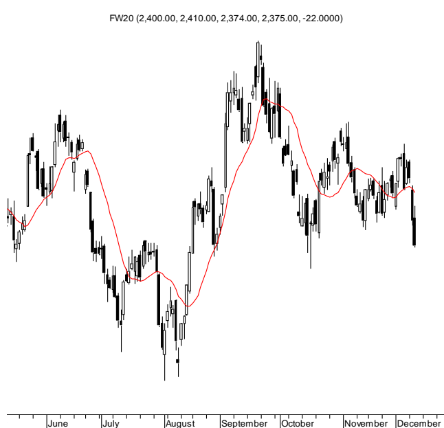
WIG20 (2,400.29, 2,407.16, 2,371.43, 2,371.43, -26.6001)