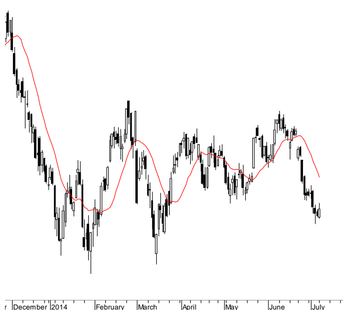
WIG20 (2,365.95, 2,386.83, 2,364.60, 2,378.88, +15.8799)