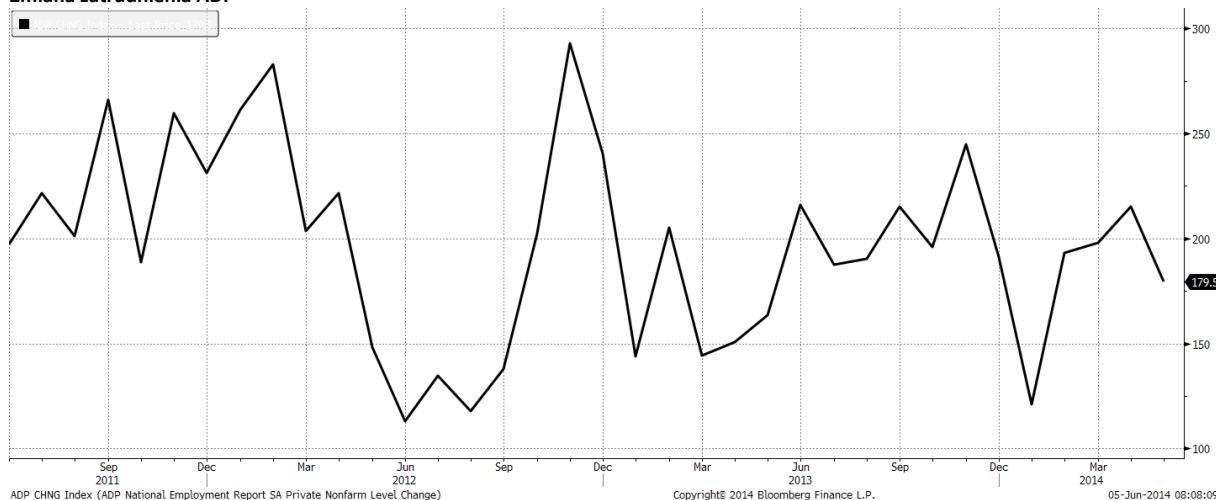
Zmiana zatrudnienia ADP

ADP CHNG Index (ADP National Employment Report SA Private Nonfarm Level Change)