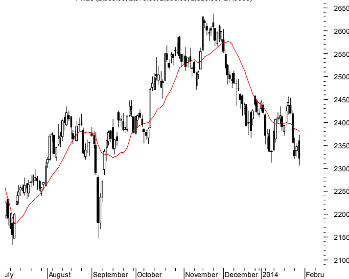
FW20 (2,360.00, 2,373.00, 2,306.00, 2,320.00, -27.0000)