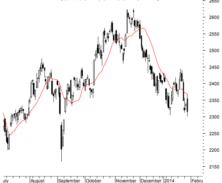
WIG20 (2,355.02, 2,367.60, 2,300.60, 2,313.34, -20.4900)