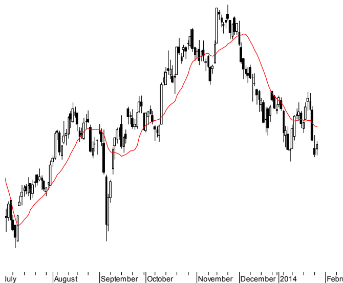
WIG20 (2,335.75, 2,342.72, 2,320.05, 2,333.83, +15.7700)