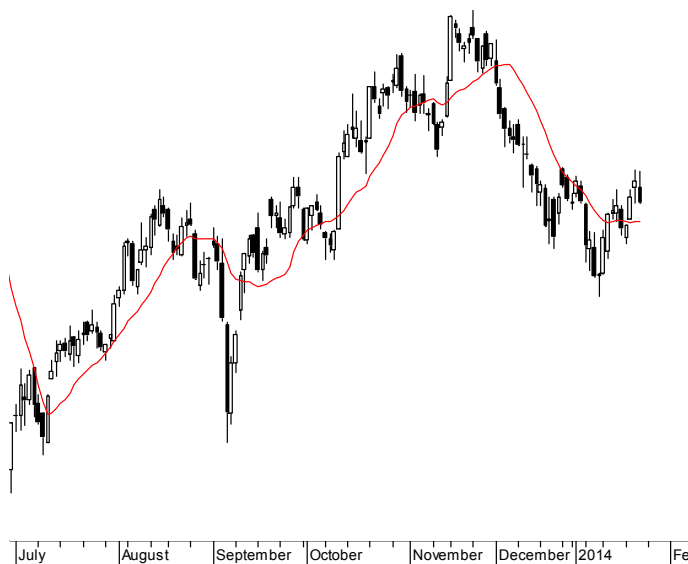
WIG20 (2,430.86, 2,440.93, 2,406.37, 2,406.37, -26.4099)