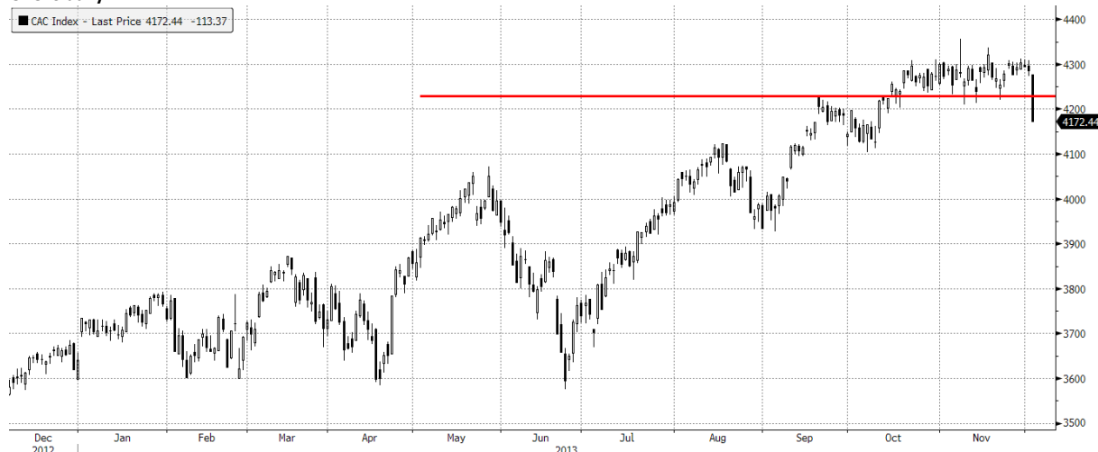
CAC Index (CAC 40 Index) Graph 533